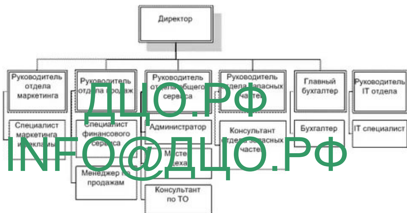
Рисунок 1 - Организационная структура ООО «Национальная медслужба»

ООО «Национальная медслужба» имеет генерального директора. В его подчинении находятся все линейные и функциональные руководители. Структура компании включает в себя несколько отделов и подразделений, основные элементы представлены в виде схемы ниже.