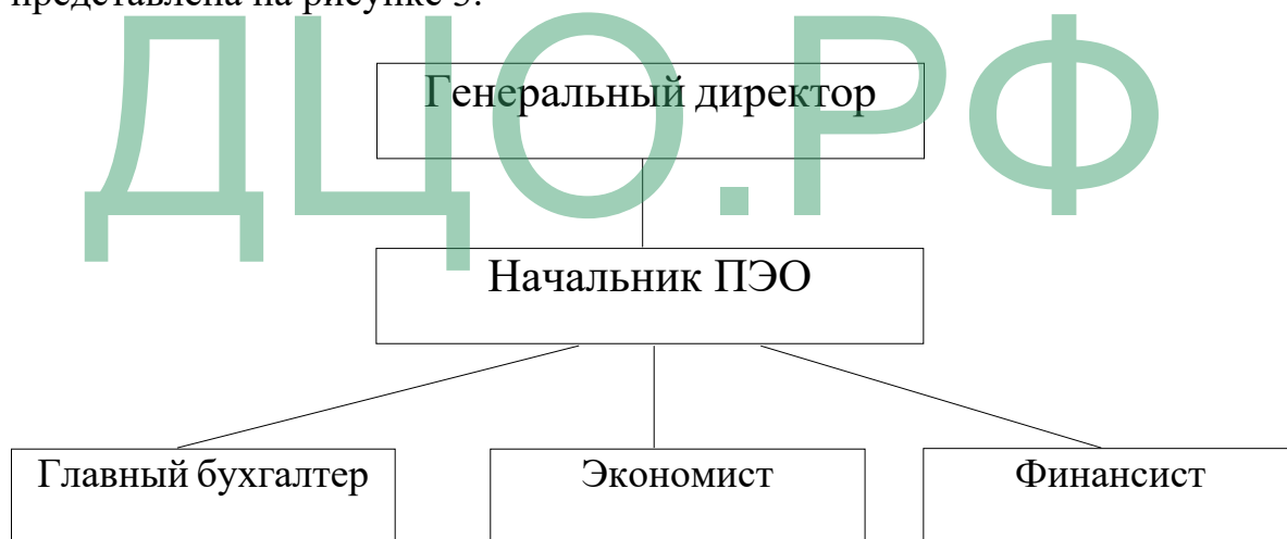
Рисунок 3 - Структура планово-экономического отдела ООО «ПК ВентКомплекс»

Структура планово-экономического отдела ООО «ПК ВентКомплекс» представлена на рисунке 3.