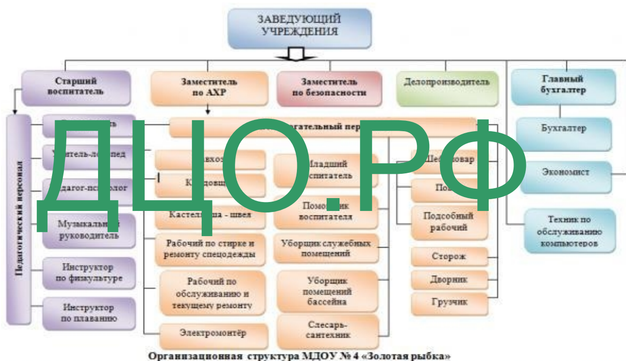
Рисунок 1 - Организационная структура МБДОУ Д/с № 22

Организационная структура МБДОУ Д/с № 22 представлена на рисунке 2.