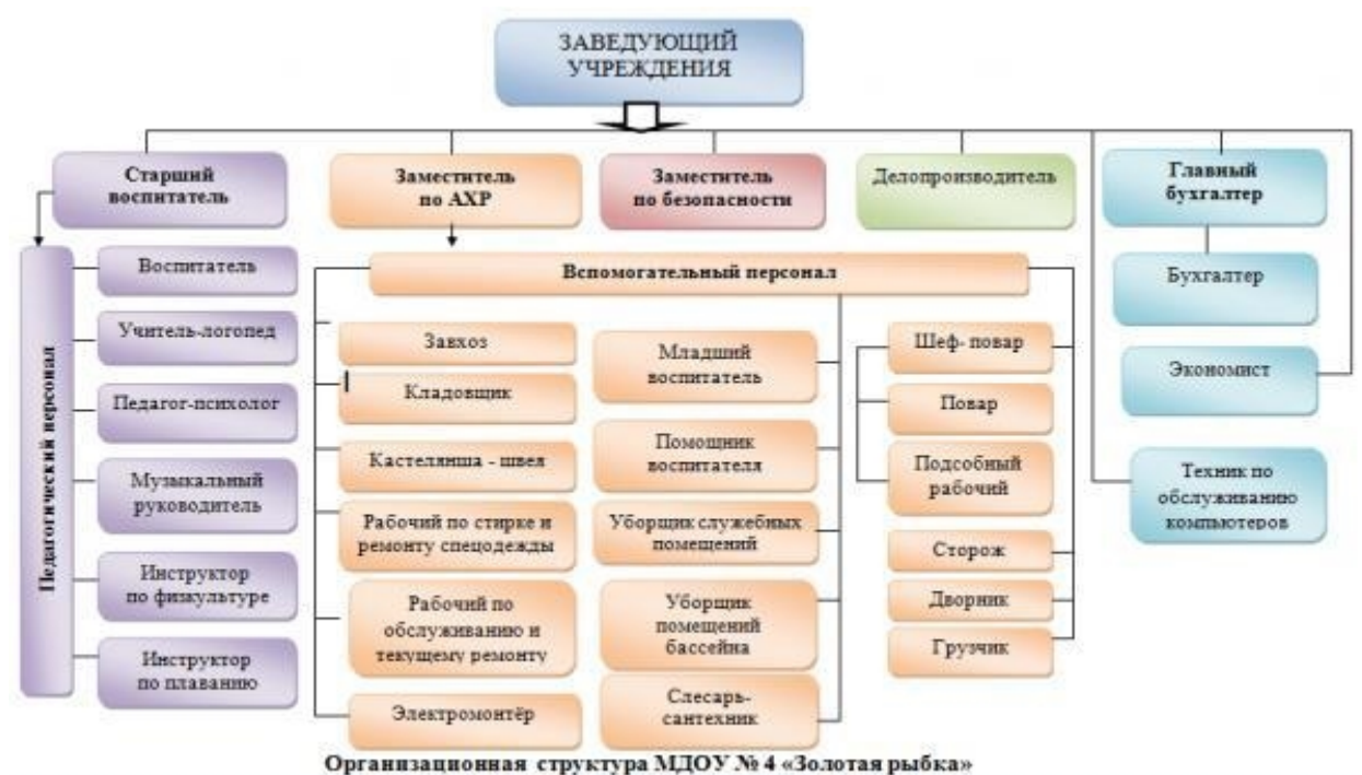
Рисунок 1 - Организационная структура МБДОУ Д/с № 22

Для оперативного руководства различными аспектами деятельности школы Директор назначает заместителей и старших методистов, определяет их должностные обязанности: