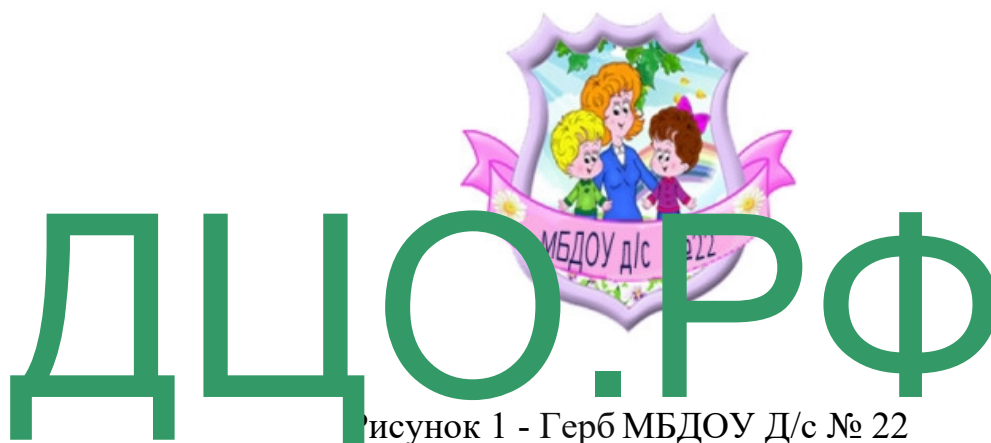
Рисунок 1 - Герб МБДОУ Д/с № 22

Воспитательно-образовательный процесс в ДОО строится на основе образовательной программы ДО МБДОУ д/с №22 (далее ОП ДО МБДОУ д/с №22)