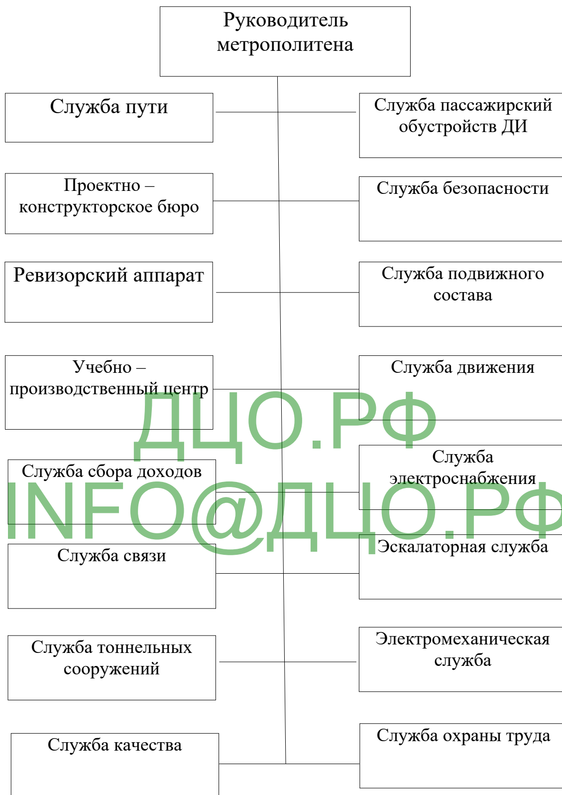
Рисунок 1 - Организационная структура ГУП Московский метрополитен

Структура управления метрополитеном - линейно-функциональная.