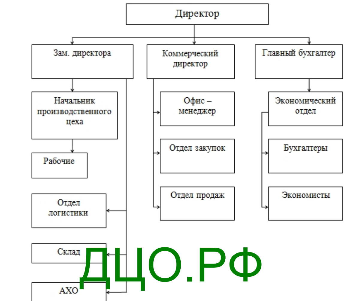
Рисунок 1 – Организационная структура ООО «Домашний интерьер» Отдел по работе с персоналом.