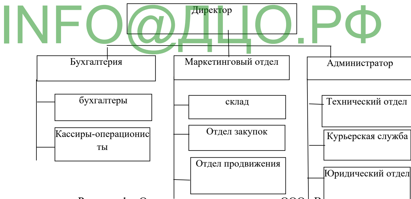
Рисунок 1 – Организационная структура ООО «Виктория»

Возглавляет ООО «Виктория» директор предприятия (рисунок 1).