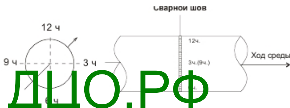
Рисунок 3 - Схема ультразвуковой дефектоскопии сварного шва и

Ультразвуковая дефектоскопия сварных соединений трубы и 90° отвода проводилась на контрольных участках №1.2 и №2.1. Ультразвуковая дефектоскопия сварных швов и околошовных зон трубопроводов проводилась вдоль сварных швов по ходу часовой стрелки (см. схему, изображенную на рис. 3).